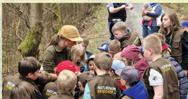
große Freude bei der Arbeit mit Kindern