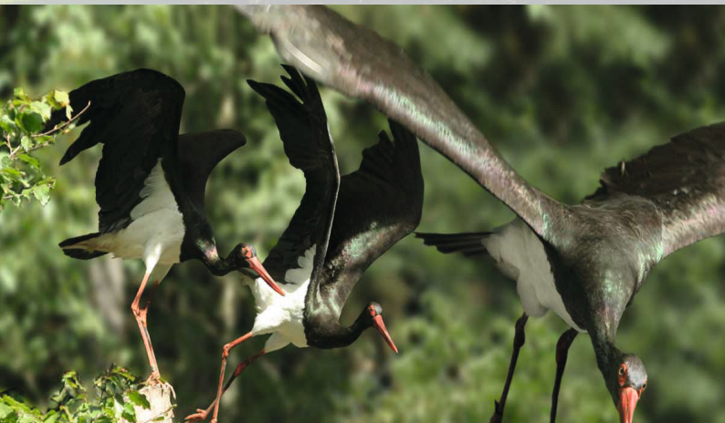
Majestätisch gleiten die Schwarzstörche über die Wiesen & Baumwipfel im Frankenwald.

Die Radwege in den Tälern bieten sich für Rennradtouren an, der Frankenwald lädt zum Mountainbiken ein und auf den Höhen hat man beim Laufen wunderschöne Aussichten. Seit der Geburt der Kinder haben wir weiterhin an kleinen Triathlons teilgenommen, aber für größere Projekte fehlt uns im Moment die Zeit. Nun genießen wir es, am Wochenende längere Läufe und Mountainbike-Touren durch den Frankenwald zu machen.