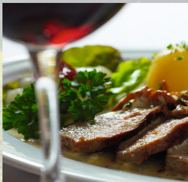
Wildschweinbraten aus heimischen Wald