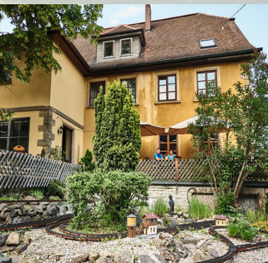
elterlicher Landgasthof in Hermes

Nein, genau das Gegenteil ist der Fall. Wenn man wie ich den ganzen Tag in der Küche steht und hier und da probiert, brauche ich am Abend auch mal was Süßes.